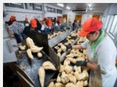
トリミングライン