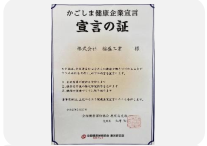
「健康企業」を宣言し、社員全員の心身が健康でいられる職場づくりに取り組んでいます。