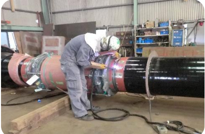
安全に作業を行うため、溶接する際はヘルメット、頭巾、マスク、手袋などを必ず装着して行ひます。

工場では主に階段や手すりの他タンク等も製作します。現場は発電所や県内の建設現場で出張もあります。